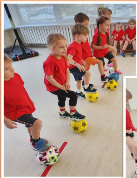
Klaipėdos lopšelis - darželis „Želmenėlis“ Grupė „Šnekučiai“ 2024 sausis